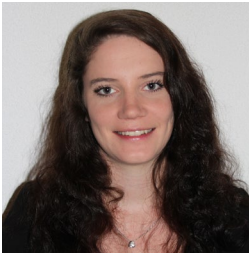
Primarlehrerin Cornetistin in der MG Dürrenäsch Cornetistin in der BB Imperial Lenzburg